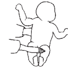
Figura 7. Examen de la resposta de Moro.

Explorar-lo amb maniobra de Lamote de Grignon segons la figura 7.