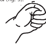
Figura 5. Polze adduït