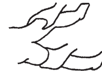
Figura 6. Exploració de l'angle d'adductors.