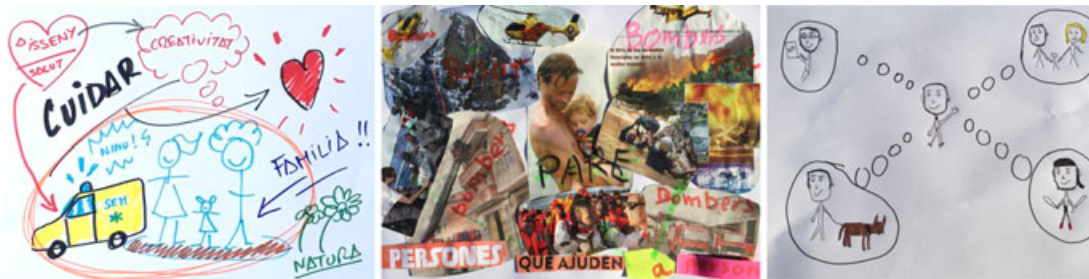
Exemples dels nostres Selfies personals realitzats amb diferents tècniques.

S'han demostrat efectes positius d'aquest tipus de tallers en persones grans sanes o amb qualsevol tipus de demència. (3) Sovint no cal esperar que es mantinguin les habilitats treballades, en aquest cas la memòria, més aviat s'intenta que el deteriorament de les mateixes no avanci tan ràpidament o que fins hi tot es recuperi en part, facilitant així l'adaptació de cada individu al seu inexorable procés d'envelliment. A pesar de tot, extenses revisions bibliogràfiques sobre l'entrenament i la rehabilitació cognitiva apunten a que encara hi ha una manca d'evidència científica molt gran en aquest camp (4) i això en part es degut a que no existeixen unes eines de consens per avaluar l'efectivitat de la intervenció amb aquests tipus de tallers d'estimulació cognitiva i rememoració.