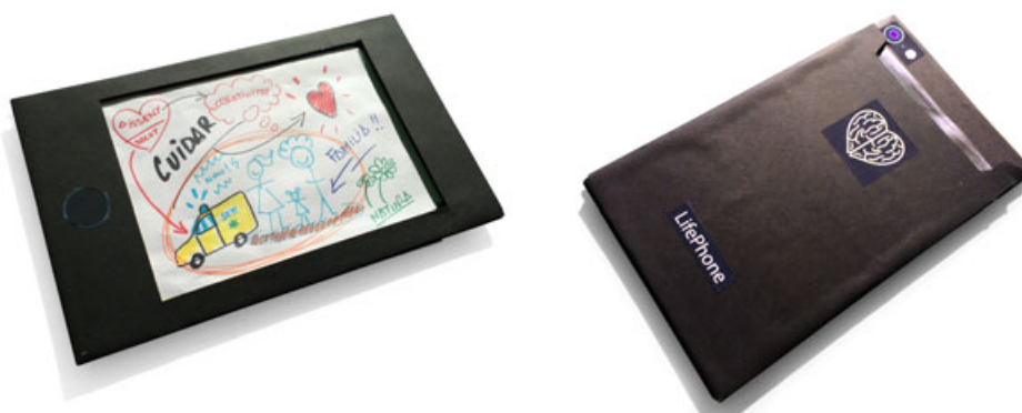
LifePhone, el suport preparat per mostrar els Selfies més especials i personals