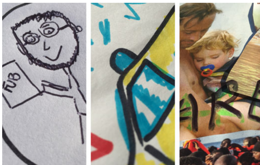
Exemples de diferents tipus d'expressió artística (bolígraf, rotuladors de colors, collage...).

Així doncs, per començar necessitarem: folis DIN A4, revistes, diaris amb articles fotogràfics, retoladors de diferents colors, llapis de colors, gomes d'esborrar, bolígrafs, tisores, cola de barra, etc. El segon dia, a més del material per acabar les Selfies , es necessita el LifePhone (caixa simuladora) prèviament fabricada pels dinamitzadors, per exposar els Selfies de cadascú.